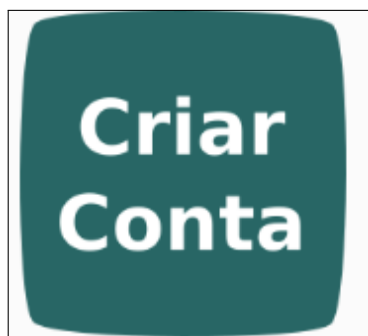
Figura 1: Criar uma conta na plataforma.

Antes de poder fazer a inscrição numa ação de formação deverá criar uma conta na plataforma de gestão da formação. Para isso aceda a http://projectos.eses.ips.pt/acd/ e clique no botão que representamos na Figura 1 .