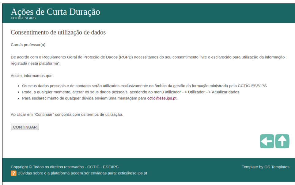
Figura 6: Consentimento esclarecido para utilização de dados

Caso não concorde com essa mensagem não deverá prosseguir, nem clicar em “concordo”. Deverá enviar um mail para cctic@ese.ips.pt solicitando a remoção dos seus dados da plataforma.